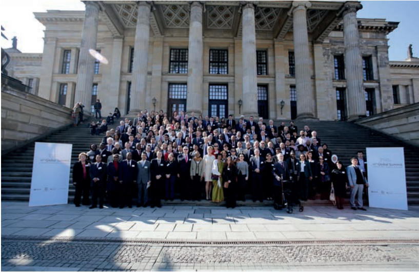
Foto grupal de los asistentes a la 11ª Cumbre ante la Sala de Conciertos de Berlín.