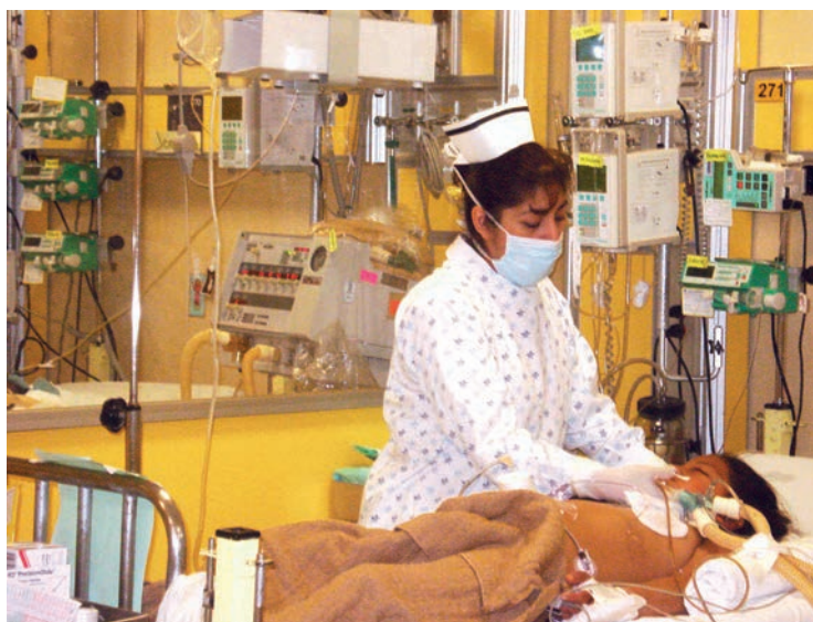
Paciente pediátrico en la unidad de terapia intensiva.

en la autoridad, y que para ejercer la autonomía se requiere poseer capacidades biológicas para un juicio racional.