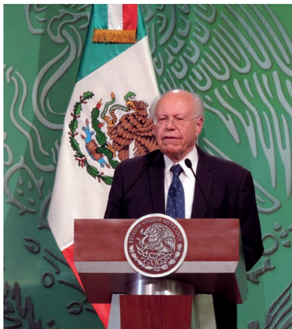
José Narro Robles, Titular de la Secretaría de Salud durante su intervención.

contribución a un gran proyecto. Durante 40 años he impulsado la enseñanza y el ejercicio de la medicina, la investigación e innovación en salud y el diálogo entre la medicina y el derecho. He participado en proyectos estratégicos para garantizar la cobertura y calidad de la atención, la descentralización y el fortalecimiento de los sistemas estatales de salud, inclusive en su reconstrucción y reordenamiento a causa de los sismos en la Ciudad de México. He defendido el valor de la medicina como una disciplina social y la visión de la salud como elemento fundamental para el desarrollo de un pueblo. El puente entre la medicina científica y el humanismo es una inquietud que me llevó a la bioética, una guía imprescindible para incidir en las políticas públicas que promueve el análisis incluyente y plural de problemáticas que aquejan a nuestra sociedad. Concientizar sobre la importancia de la ética en la investigación e integridad científica, la justicia distributiva en la asignación de recursos en salud, los efectos del cambio climático y las enfermedada-