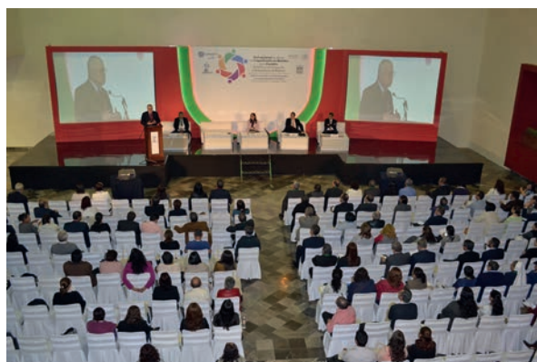
Jornada de capacitación para integrantes de CHB y CEI, Guadalajara, Jalisco 2015.

Considerando la importancia de la capacitación y difusión de la bioética, con el apoyo del Consejo Nacional de Ciencia y Tecnología, aliado inestimable de la Comisión Nacional, se impulsa actualmente la conformación de una Red Temática en Bioética, la Red Nacional de Apoyo a la Capacitación en Bioética ,