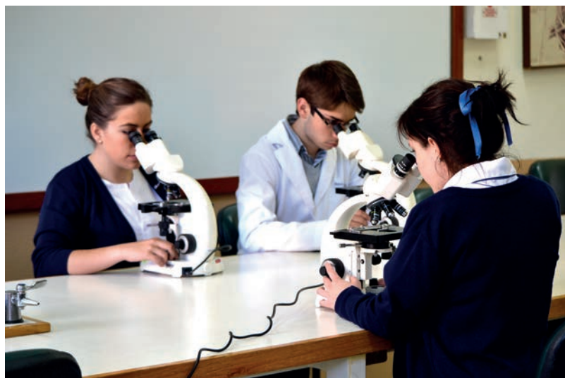
La educación y la investigación son motores del desarrollo tecnocientífico.

Las universidades tienen, por su propia naturaleza, la misión y el deber de enfrentar este estado de cosas, de ser sensibles a los signos de los tiempos y de formar las futuras generaciones en consonancia con los cambios presentes. Las realidades del mundo actual se han vuelto cada vez más confusas y menos simples. A lo largo de la segunda parte del siglo XX y, especialmente, en las últimas décadas, las interrelaciones y las interconexiones de los constituyentes biológicos, psicológicos, sociales, económicos, políticos, culturales y ecológicos, tanto a nivel nacional como mundial, se han incrementado de tal manera, que la investigación científica clásica y tradicional –con su