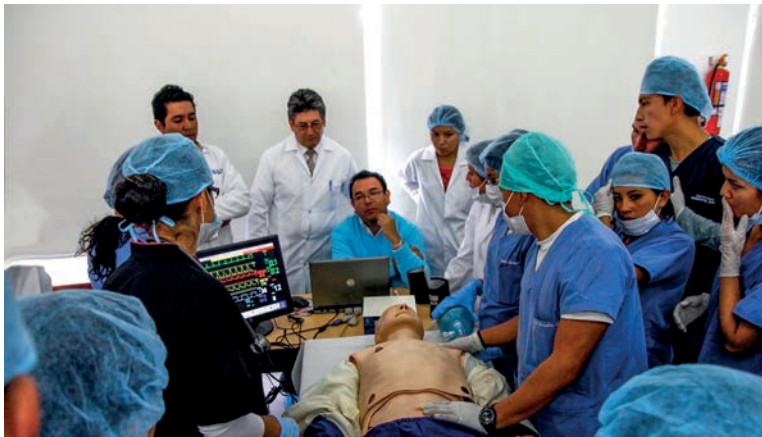
Los alumnos se pueden enfrentar a dilemas bioéticos desde los estudios profesionales.

que eludan la práctica rutinaria para adentrarse en una reflexiva, que más que criticar la actuación de los demás sean capaces de enjuiciarse a sí mismos y proceder en consecuencia, que cuestionen respetuosamente las prácticas habituales para identificar los componentes bioéticos, que se comprometan auténticamente con el bienestar de los pacientes más que con el propio y hasta con la doctrina y la ciencia, que jerarquicen a los pacientes por encima aún de los valores académicos, que procuren hacerse útiles aún en las etapas formativas iniciales, que reconozcan la importancia de encontrar para cada enfermo la mejor de las alternativas existentes, que hagan conciencia de la importancia de los costos para que, en igualdad de circunstancias, elijan la opción menos costosa.