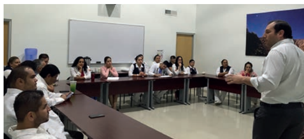
Capacitación del CHB del Hospital General de Tecate, Baja California.

Asimismo, la investigación con seres humanos conlleva riesgos para los sujetos de investigación, de ahí la necesidad de garantizar