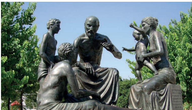
Estatua que representa a Hipócrates enseñando a sus discípulos, ubicada en la Isla de Cos, Grecia.

ción del estado de la conciencia y una merma en la capacidad de juicio debido a la condición de “debilidad” a que lo sometía la enfermedad. 2 Esta situación exigía del médico, consecuentemente, una actitud de solicitud paternal que conllevaba, por parte del enfermo, una sumisión casi absoluta ante las decisiones de aquél. Posteriormente esto dará lugar a lo que se ha denominado paternalismo médico.