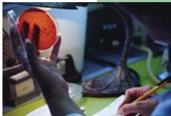
Los estudiantes serán responsables de los servicios de salud del país

mación indica que el volumen de estudiantes que debe ser formado en bioética es enorme. En unos años esta población será responsable de los servicios de salud del país, ya sea otorgando atención médica, organizando los programas y servicios, operando los programas de enseñanza o realizando investigación científica.