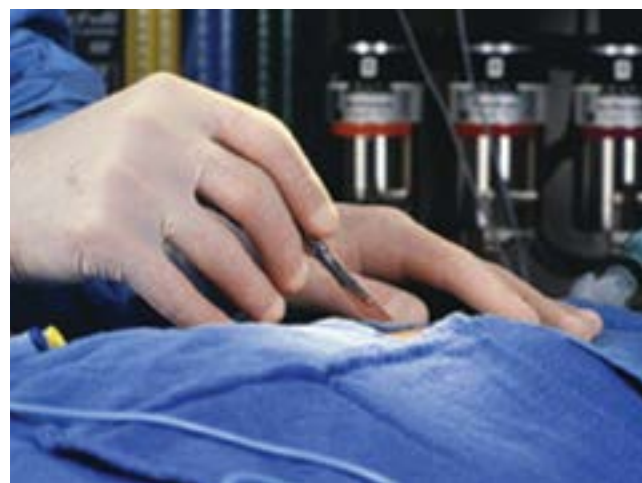
Se requieren médicos que enfrenten problemas morales

Desde nuestro punto de vista, la ética tiene dos propósitos fundamentales, uno teórico, que obedece a su naturaleza reflexiva y busca comprender qué valores deben ordenar nuestras relaciones con el prójimo, y uno práctico, que proporciona una suerte de guía para conducir nuestros actos conforme a ciertos ideales de bondad, justicia y libertad. Parece razonable pensar que las instituciones dedicadas a la formación de médicos tendrán que buscar que los estudiantes alcancen ambos propósitos, promoviendo el ejercicio permanente del diálogo libre, abierto y razonado. Es posible que alcanzando ambos propósitos puedan ser mejores profesionales y mejores personas.