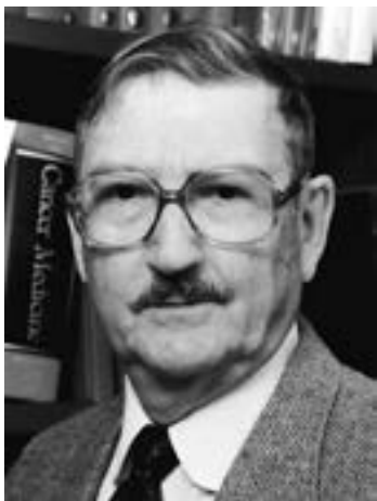
Van Rensselaer Potter

La bioética, como término, fue acuñada en 1927, sin embargo, para la mayoría de la población sigue siendo un término nuevo. Fritz Jahr fue el primero en empezar a hablar de ella en su artículo Bio-Ethik: Eine Umschau über die ethischen Beziehgendes Menschen zu Tier und Planze (Bio-Ética: una perspectiva de la ética de los seres humanos en relación con los animales y plantas) 1 , en éste, Jahr buscaba entablar una responsabilidad del hombre hacia el entorno, enfocándose en la fauna y la flora del medio que le rodea en el día a día. Años más tarde, en 1979, Van Rensselaer Potter retoma el concepto bioética como la ciencia de la supervivencia ante los avances científicos y tecnológicos en su publicación Bioethics: bridge to the future (Bioética: puente hacia el futuro) 2 . Es tras esta publicación que la bioética realmente comienza a tener relevancia, expandiéndose por el mundo ante los diferentes dilemas que enfrenta nuestros tiempos como consecuencia del incesante avance de la ciencia y la tecnología, así como de la aparente ruptura entre éstas y las humanidades.