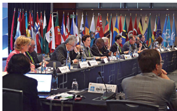
Sesión de Investigación en salud y los grupos en condiciones de vulnerabilidad

Se destacó el papel de los familiares durante el proceso de consentimiento informado y la participación en los beneficios de los resultados de la investigación como elementos clave para la protección de los menores. Asimismo, se expuso la necesidad de mejorar los controles y armonizar las reglamentaciones para prevenir abusos y malas prácticas que puedan surgir al llevar a cabo investigaciones con niños en países de bajos recursos. En esta sesión se contó con las participaciones de Calvin Ho y Alastair Campbell, ambos de Singapur; Hugh Whittall, de Reino Unido; Michel Daher, de Líbano, y Christine Grady, de Estados Unidos. La sesión estuvo coordinada por Paul Ndeble, de Zimbabwe y Leonardo de Castro, de Filipinas.