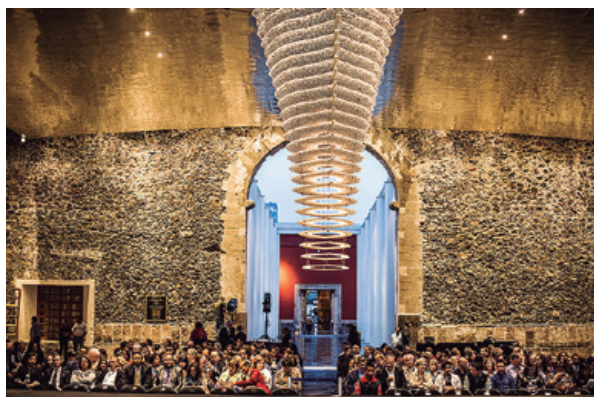
Biblioteca México, sede de la actividad cultural