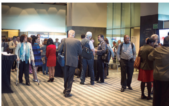
Primer día del Congreso