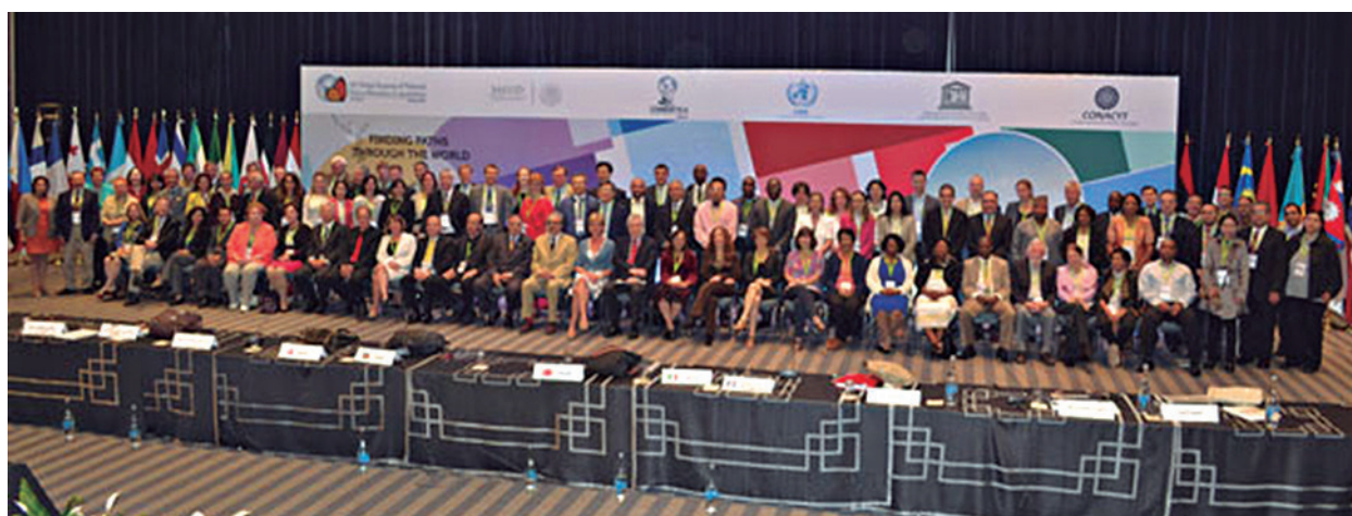
Delegados oficiales y asistentes de la 10ª Cumbre Global