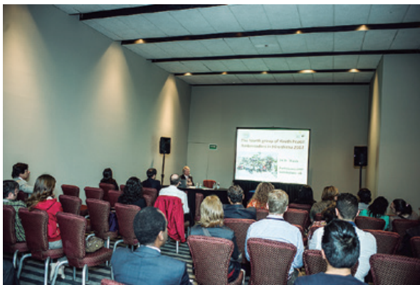
Sesión de la Red Iberoamericana de Bioética

Los ejes temáticos abordados en el Congreso fueron: