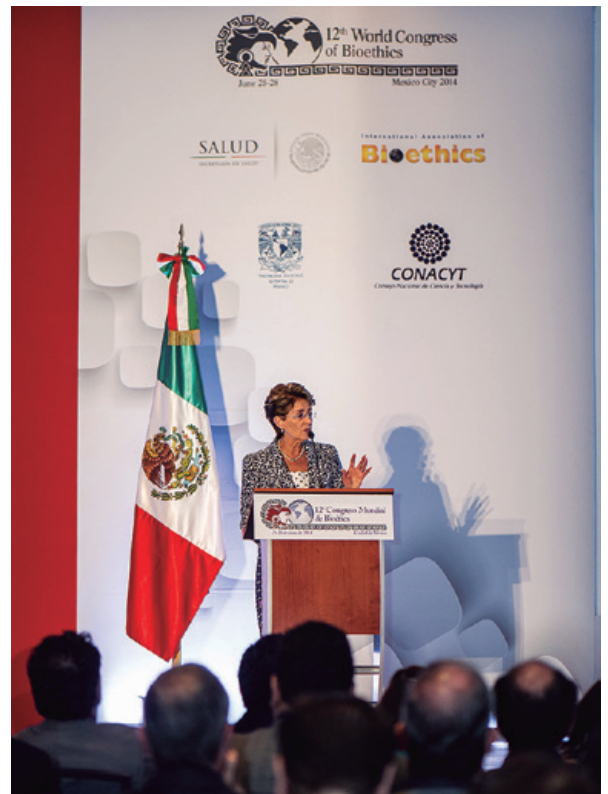
Mercedes Juan López