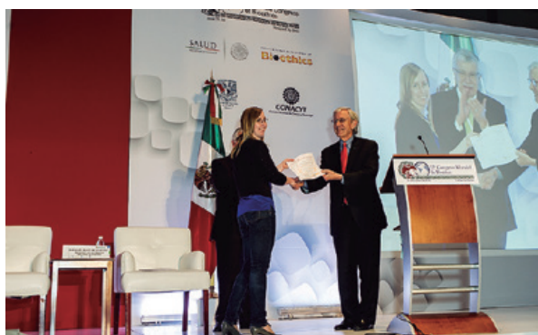
Ganadora del Mark S. Ehrenreich Prize in Healthcare Ethics Research 2014