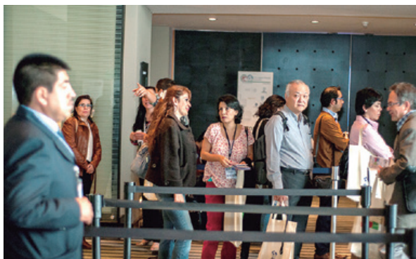
Registro al Congreso

En su décimo segunda edición, los asistentes al Congreso Mundial de Bioética presenciaron 30 conferencias magistrales, 50 simposios con 170 expertos internacionales, 290 presentaciones orales y 78 posters por parte de académicos, investigadores y estudiantes de pre y posgrado, así como profesionales de la salud.