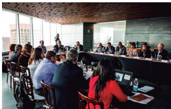
La XLVIII sesión del Consejo de la Comisión Nacional de Bioética

La sesión concluyó con la discusión de algunas dificultades en la creación y el mantenimiento de redes educativas en un contexto multicultural, para hacer frente a diferentes retos y establecer acuerdos de trabajo conjunto, teniendo en cuenta la situación compleja que representa el pensamiento religioso y los conflictos de interés. Cabe destacarse que es la primera vez que se da una reunión de esta importancia, en la que participen destacadas personalidades de la bioética en el contexto global.