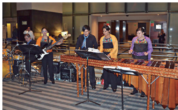
Marimba interpretando música tradicional