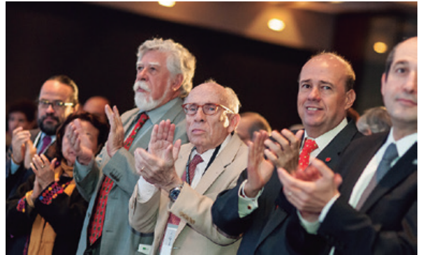
Asistentes a la sesión inaugural