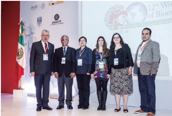
Ganadores de la Guillermo Soberón Travel Grant con el Presidente del Congreso