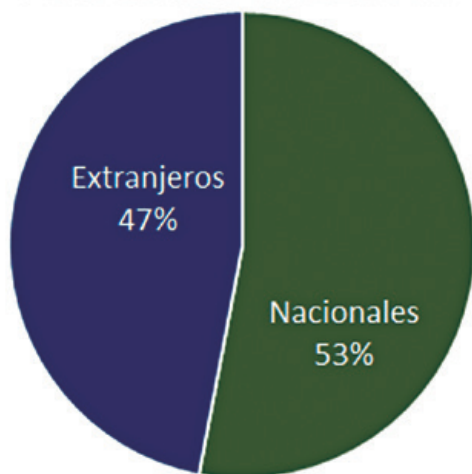
Asistentes al 12° WCB