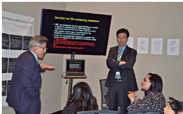
Presentación de la delegación de Corea

La dinámica consistió en que los representantes de las comisiones compartieran con sus colegas, en un ambiente académico y ameno, las experiencias, retos y cuestiones abordadas en sus instituciones. Dicho intercambio de ideas favoreció el diálogo intercultural sobre temas como: aspectos éticos en la investigación biomédica, cobertura universal en salud, difusión de la bioética para niños y jóvenes, consentimiento informado, dilemas al final de la vida, biodiversidad y medio ambiente, entre otros.