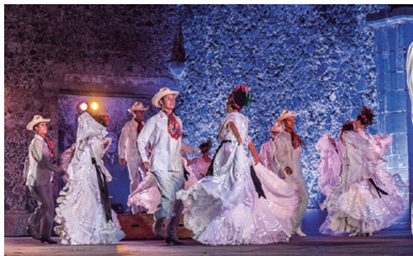
Ballet Folklórico de México de Amalia Hernández