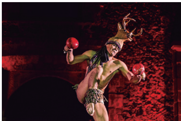
Danza del venado