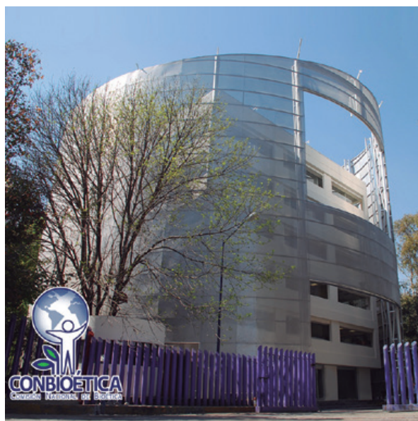
Sede de la Comisión Nacional de Bioética