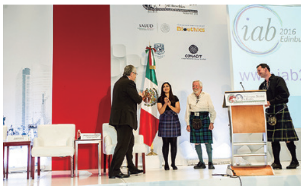
Anuncio de la próxima sede del 13º Congreso Mundial