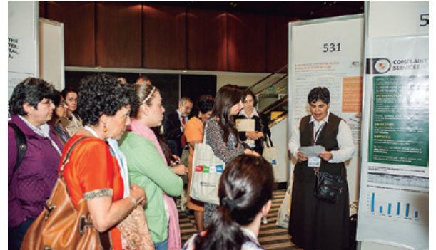
Presentación de posters