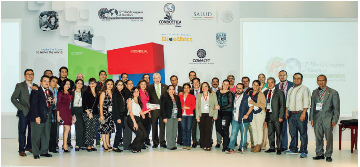
Colaboradores de la Comisión Nacional de Bioética

Asimismo, se hace un reconocimiento especial a cada uno de los colaboradores de la Comisión Nacional de Bioética cuya labor y compromiso se reflejó en el éxito de los eventos mundiales de 2014.