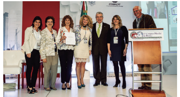
Ganadoras del tercer lugar del MH-PosterPrize